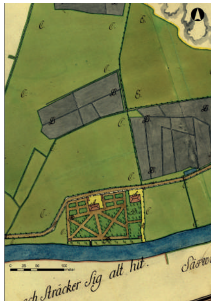
Figur 8. Gamlestadens landeri 1769. Karta: Lantmäteriet N31-I:12.

figur 8). Det innehades då av superkargören i Ostindiska kompaniet Christian Tham. Mangårdsbyggnaden och en trädgård låg omedelbart norr om Säveån. Trädgården var "anlagd i figur av St. Andreae Orden" med två större bäddar med korsformade gångar och en rak siktlinje ned mot ån. Mot Säveån fanns en terrasskant med mur och trappa ned mot ån. Inom landeriets område fanns också en krog "som trädgårdsmästaren mot arrende nyttjar" och ett torp, vars åbo gjorde dagsverken på gården. Fischer (1923:49) menar att planen tillkommit då Tham tillträdde landeriet 1760. Detta bekräftas av texten på kartan som anger att landeriet främst hade använts till betesmark före 1760.