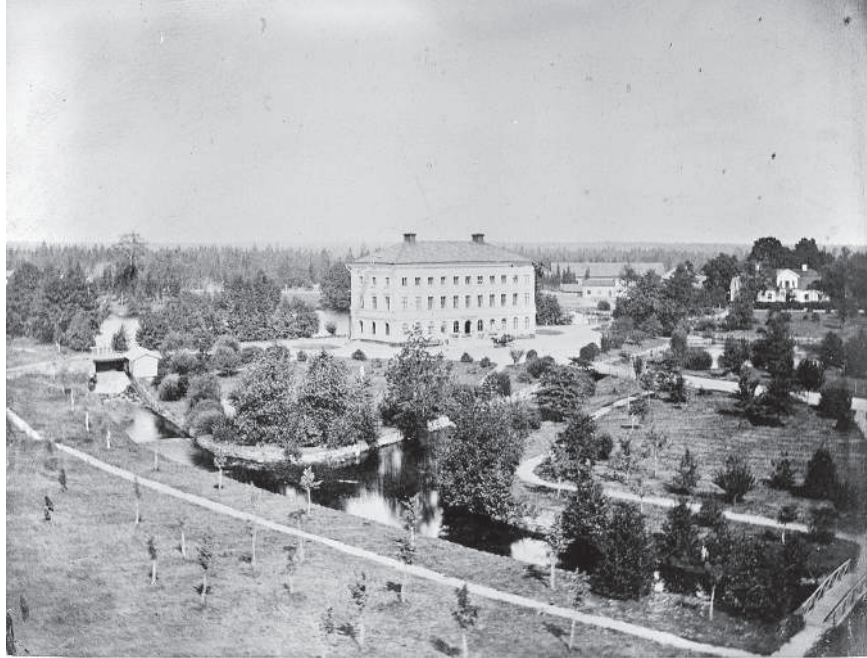
Figur 1. Mitt i bilden syns den nyuppförda huvudbyggnaden "Slottet", till höger skimtar den gamla herrgårdsbyggnaden. Den engelska parken är nyanlagd med nyplanterade träd, grusade gångvägar, vattenspeglar och vattenfall. Foto från år 1877, Jernkontoret.

(1998:808). Syftet med reservatsbildningen är att kunna skydda, bevara och vårda kulturhistoriskt värdefulla landskap, vilket även omfattar områden med äldre industriell verksamhet.