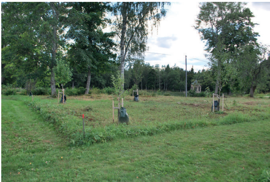
Figur 9. I hörnen av de historiska odlingsbäddarna i växthusträdgården har äppelträd planterats. Därmed tydliggörs trädgårdens ursprungliga struktur.