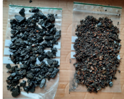
Figur 8. Grusprover från gångvägarnas beläggning i engelska parken. Proverna tvättades i fält. Till vänster i bild ett gulrött morängrus och till höger ett grövre gråsvart skiffergrus.

nas skiffer kommer därifrån. Till skillnad mot skiffergruset kommer det gulröda gruset sannolikt från lokala täkter (Blennå & Lindeblad 2022a:18). Intressant är att även om gruset i både växthusträdgården och engelska parken kommer från lokala förekomster så har de ändå hämtats från olika platser. Kanske visar det skillnaden i status mellan nyttotradgården och lustparken.