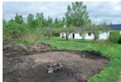
Figur 5. Entrégången till växthusträdgården där stenskodda stolphål visar var grinden varit. I bakgrunden syns växthusbyggnaden med de framförvarande äppelträden som planterades när trädgården anlades.

De övriga gångarna har varit 1,2 meter breda, motsvarande ungefär två alnar. Eftersom trädgården har brukats under lång tid, då gångvägarna underhållits och förnyats, har det ibland varit svårt att bestämma den exakta bredden. I västra delen av trädgården hittades gångvägar som inte finns markerade i det historiska kartmaterialet och som utgör ett yngre skede i trädgården.