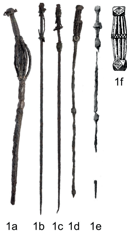
Figur 1. Stavar med järntrådar. 1a: Klintastaven, Klinta SHM 25840:59. 1b: Karlshult SHM 10243: XV. 1c: Gnestad SHM 9060. 1d: Birka SHM 34000, Bj834. 1e: Birka, SHM 34000 Bj845. 1f: Toppen på 1d avritad av Harald Faith-Ell, beskuren.

hon tolkat som stekspett och delat in i fyra undergrupper. Särskilt typ III-spetten, "Stekspett med egna handtag" och mer specifikt underkategorin "m", "med järntrådar" överensstämmer med de fem stavar som behandlas här (Bøgh-Andersen 1999, s. 114). Flera forskare har dock ifrågasatt tolkningen av specifikt typ III-spetten som stekspett. Detta på grund av svårigheterna att hålla dem utan att bränna sig samt att deras ornament gör det problematiskt att