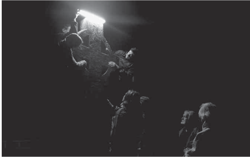
Figur 2. Släpljusundersökning av Grenskorset i samarbete med universitetet i York: Foto: Mästerbyprojektet.

Befolkningsmängden på Gotland under medeltid är inte känd. En uppskattning är att den totala mobiliseringsstyrkan i samband med den danska invasionen bör ha varit mellan 4 250 och 5 000 man, med tanke på att många stora gårdar kunde bidra med i genomsnitt fyra man (Westholm 2007, s. 133). Av dessa kan minst 500 man ha deltagit i striden på Fjäle myr. Det är inte heller känt hur många man den danska armén bestod av, men cirka 1500–2500 man är en trolig siffra i jämförelse med ungefärligen samtida krigståg. Den danska armén bestod till stor del av professionella tyska legosoldater (Hammarhjelm 1998, s. 70; Westholm 2007, s. 138 och där anförd litteratur).