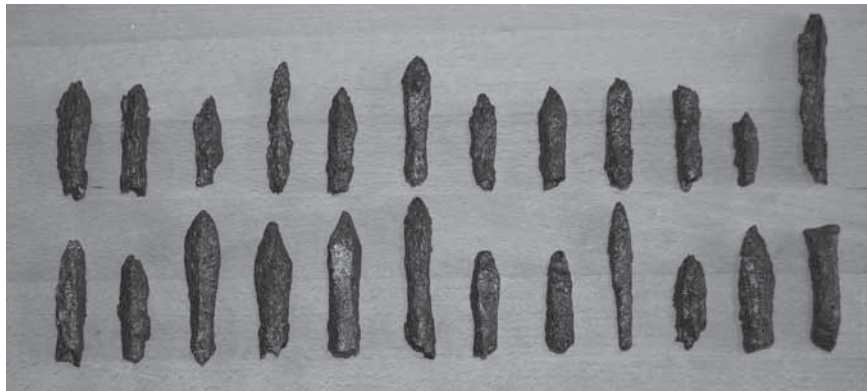
Figur 9. Armborstpilspetsar från 2018 års undersökning.

med Tyska Ordens invasion av ön år 1398 (Westholm 2007, s. 284).