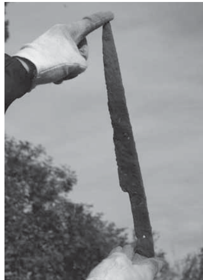
Figur 5. Stridskniv (F10) från 2006 års undersökning före konservering.

Den första fältveckan år 2006 resulterade i flera slagfältsrelaterade