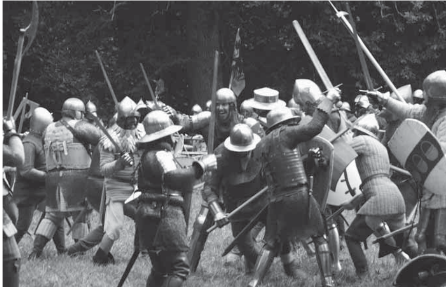
Figur 10. 2013 års reenactment i Mästerbyänget. Fyra reenactments har under åren 2011–2019 arrangerats. Flera hundra deltagare från upp till 20 länder, och en publik på upp till 2000 personer per gång visar på intresset för återskapandet av stridigheterna i Mästerby.

vi i myrens smalaste parti ser tecken både på distansstrid och närstrid: en distansstrid där gotlänningarna fattat posto norr om myren och danskarna anföll från området söder om myren. Gotlänningarna lyckades i detta skede pressa tillbaka den mindre styrka som danskarna först skickade ut på myren. Det är därför vi även ser tecken på närstrid, i form av delar av vapen, inom denna del av slagfältet. Då danskarna satte in hela sin styrka av yrkessoldater var dock gotlänningarna chanslösa. Danskarna tog sig över myren och ut på bredd. Sedan var utgången given och vägen mot Visby låg öppen.