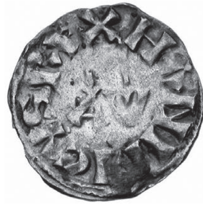
Figur 3. Mynt slaget för Annas gemål, Henrik I, i Paris. Inskription HANIRICVS REX. I mittfältet hängande alfa och omega (s. k. pendilia), en Kristussymbol. (CC0)

Som en parallell till Ingegerdsringen från Sigtuna förekommer i källorna en ring som eftervärlden förknipat med Anna Jaroslavna. Det omnämns nämligen att den dåvarande kungen Ludvig VI år 1137 donerade en ring med en ovanlig ädelsten, en brandgul, genomskinlig så kall-