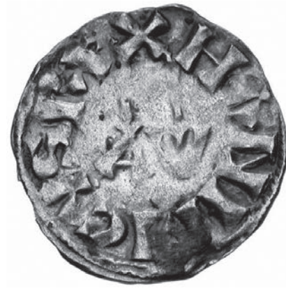
Figur 3. Mynt slaget för Annas gemål, Henrik I, i Paris. Inskription HANIRICVS REX. I mittfältet hängande alfa och omega (s. k. pendilia), en Kristusymbol.

Som en parallell till Ingegerdsringen från Sigtuna förekommer i källorna en ring som eftervärlden förknipat med Anna Jaroslavna. Det omnämns nämligen att den dåvarande kungen Ludvig VI år 1137 donerade en ring med en ovanlig ädelsten, en brandgul, genomskinlig så kall-