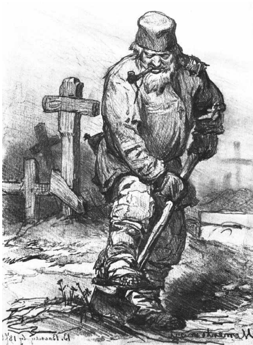
Figur 2. Hur grävdes graven och av vem/vilka? Målning från 1871 av Viktor Vasnetsov. Från Wikimedia Commons ( http://commons.wikimedia.org/wiki/File:Vasnetsov_Grave_digger.JPG ).