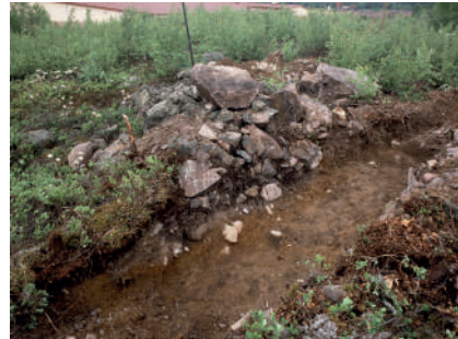
Figur 3. Odlingssytan med tillhörande stenvall. Foto från nordnordväst. Fotograf: Anna Lögdqvist, Dalarnas museum, DM_2005 18_10 5.

Platsens läge gör den intressant att studera dels ur gruvans perspektiv, dels utifrån Falu stadsbildnings perspektiv. Undersökningen berörde de sydvästra delarna av Falun L2001:4194 och de nordvästra delarna av Falun L2001:4261 registrerade (KMR) som bytomt/gårdstomt. Förundersökningen innefattade både inventering och en sökschaktsgrävning. Sammanlagt påträffades trettiofem lämningar av varierande ålder, bland