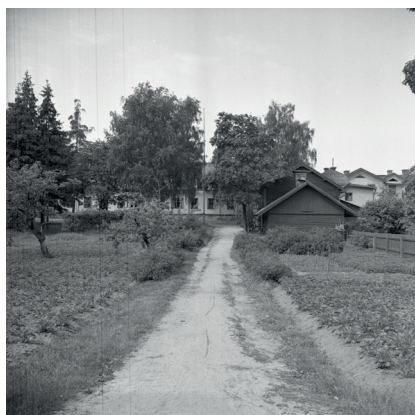
Figur 7. Gården bakom gamla komministerbostaden från Trotzgatan. Numera benämnd som gamla Postenparkeringen och som Arkeologikonsult undersökte år 2019

De tydligaste tecknen på att området delvis utgjorts av trädgård var det tjugotal planteringsgropar som var formerade i två rader genom området. Groparna som var mellan 0,80 och 1,65 meter i diameter och mellan 0,50 och 0,80 meter djupa var till största delen rundade och fyllda med slagg blandat med mindre mängder jord och träffis. Ett par av groparna innehöll också kolstybb. Sannolikt var det groparnas botten som framträdde. Själva planteringsjorden har försvunnit i och med sentida markarbeten. På ett par ställen fanns också fyrsidiga gropar med tätt lagda trästockar. Vissa av trästockarna hade hål och urtag och var uppenbart återanvända. Vilken funktion dessa haft är inte känt. Möjligen är dessa spår av träd- eller