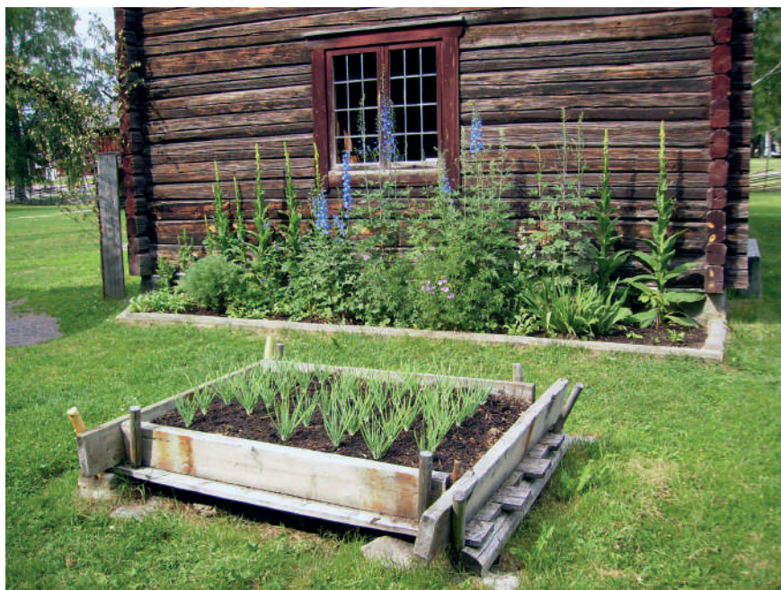
Figur 8. Plantlave, även kallad plantskulle, vid Leksands hembygdsgårdar.