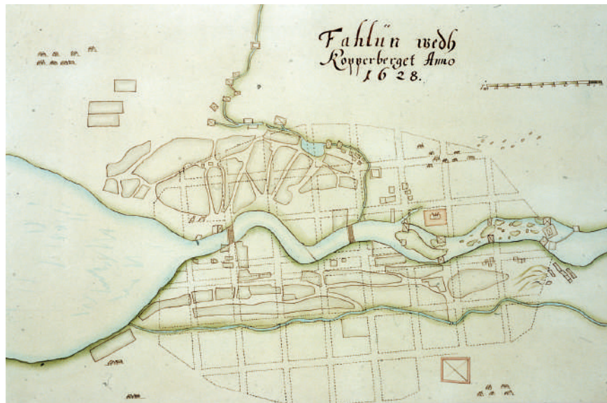
Figur 1. Faluns äldsta karta från år 1628. Den övre delen är den västra gruvliga sidan, och den nedre är den östra ljuvliga sidan. Svenska planteboken, Riksarkivet.

Gruvdriften har påverkat staden både positivt och negativt. Det var förmodligen en blygsam gruvbrytning i början, men den växte rejält under medeltiden (Bindler & Rydberg, 2015) med hyttor utspridda över Kopperberg och runt Falun. Den lokala miljön blev fördärvad med giftig mark och förorenad luft i flera århundraden. Kallrostar, vändrostar och kopparhyttor orsakade en skadlig miljö och roströk när kopparmalmen skulle förädlas. Under mitten av 1600-talet skedde en kraftig ökning av råkopparproduktionen (Geijerstam m.fl. 2011:61), vilket kan ha inneburit att roströken dödade all närbelägen växtlighet. Tack vare gruvindustrin blev Falun en internationell och välmående stad under 1600-talet, och gruvan utvecklades till en av Sveriges största