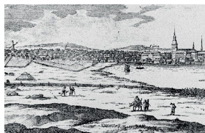
Figur 5. Illustration av staden Falu under andra halvan av 1600-talet. Till höger ligger sjön Tisken, till vänster ett inhägnat odlingsområde (Daglöstäckten). I bakgrunden ligger staden. (Kungliga biblioteket (online), Erik Dahlberghs Suecia antiqua et hodierna 1660–1696.

I Erik Dahlberghs Suecia antiqua et hodierna från år 1660–1696 (KB) finns ett kopparstick över Falu stad där man i bakgrunden ser odlingsjord söder om kvarteret Västra Falun. På 1761 års stadskarta som upprättades efter stadsbranden, finns samma kålgårdsområde utmarkerat strax sydost om kvarteret, då benämnt som Daglöstäckten. Förklaringen till namnet Daglösa varierar från brist på dagsljus, till Dagfinns äng (Hemström 1991). Dahlberghs skildring över Falu stad är på många