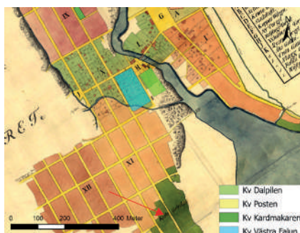
Figur 6. 1761 års stadskarta rektifierad mot fastighetskartan. Den röda pilen pekar mot kålgårdar belägna vid Daglöstakten. Skala 1:8500, LMV U9-1:1

sätt överdrivna, men vissa saker kan stämma. Odlingområdet med staket är ett sådant exempel, som Dahlberg avbildat strax söder om bebyggelsen på den ”gruvliga sidan”. Det sträcker sig ned till ett sankt område nära ån och sjön Tisken. Tillsammans med resultaten från kvarteren Kardmakaren och Dalpilen, samt de makrofossilanalyser som är gjorda inom kvarteret Västra Falun och de dokumenterade gårdesgårdarna, visar att stadsodling bedrivits samt haft någon form av temporär djurhållning, eller liknande. Möjligtvis har det även fortsatt norröver till kvarteret Kardmakaren under slutet av 1500-talet, början på 1600-talet. Det finns en viss diskrepans i de historiska källorna, bland annat finns uppgifter om att det år 1640 såldes ett stycke egendom och trädgård på Prästtåkten, mellan två andra fastigheter, tydligen tidigare såld, på grund av röken (Hammarström, 1990:139). I ett memorial från Drottning Kristina i samband