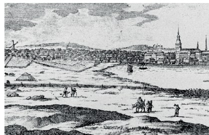
Figur 5. Illustration av staden Falu under andra halvan av 1600-talet. Till höger ligger sjön Tisken, till vänster ett inhägnat odlingsområde (Daglöstakten). I bakgrunden ligger staden. (Kungliga biblioteket (online), Erik Dahlberghs Suecia antiqua et hodierna 1660–1696.

I Erik Dahlberghs Suecia antiqua et hodierna från år 1660–1696 (KB) finns ett kopparstick över Falu stad där man i bakgrunden ser odlingsjord söder om kvarteret Västra Falun. På 1761 års stadskarta som upprättades efter stadsbranden, finns samma kålgårdsområde utmarkerat strax sydost om kvarteret, då benämnt som Daglöstakten. Förklaringen till namnet Daglösa varierar från brist på dagsljus, till Dagfinns äng (Hemström 1991). Dahlberghs skildring över Falu stad är på många