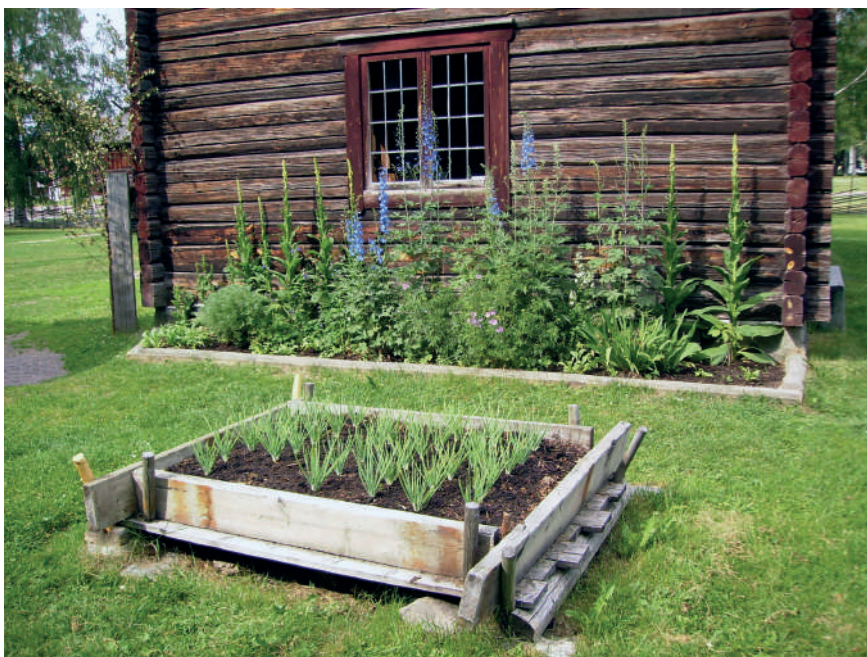
Figur 8. Plantlave, även kallad plantskulle, vid Leksands hembygdsgårdar.

palsternacka, rödbeta och persilja räknades i vissa fall som kryddor och odlades därmed i kryddgården. I källorna verkar det som att gränsen mellan kryddor och grönsaker (kål) var flytande (Hallgren 2016). Vi kan alltså anta att man odlat en variation av det vi idag kallar kryddväxter, grönsaker och rotfrukter i Falu stad trots uppfattningen om att det var omöjligt att odla i roströken från kopparhanteringen. I Abraham Abrahamsson Hülphers dagbok från en resa i Dalarna 1757 låter han meddela att roströken inte alls påverkar växtligheten så kraftigt som det sägs (Hülphers 1757). Det går alldeles utmärkt att odla både äpple, moreller och krikon. Hülphers