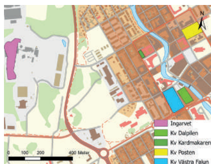
Figur 2. Översiktsskarta med de platser som nämns i artikeln, skala 1:10 000.

Även om gruvan numera är stängd påverkar dess tidigare industri fortfarande den lokala miljön. Falu kommun råder invånarna att ta jordprover för blyanalys om de tänker odla grönsaker i sina trädgårdar. De råder också invånarna att skölja och skala odlade grönsaker mycket noggrant, samt att inte plocka svamp eller bär i vissa områden (Falu kommun, hemsida, metaller i mark och vatten, råd och riktlinjer, 2025-01-09). Tidigare har historiker hävdade att odling praktiskt taget var obefintlig i Falun. Exempelvis Sahlström utgår från att kålgårdar och andra köksväxtodlingar har legat i den obebyggda, förhållandevis jämna, sluttningen öster om Trumbäcken, eller till och med ännu mera avlägset (Sahlström 1961:14, 74). Det är i och för sig inte omöjligt, och uppfattningen att det inte gick att odla i staden på 1600- och 1700-talet är förståelig. Linné beskrev Falun som beläget i en oval dalgång med höga, sterila och torra berg, och att marken var helt kal på grund av giftig rök (Carsson & Jacobsson, 2007: 31, 34). Utanför Falu gruva beskriver Linné att ”det går en förgiftig, stickande svavelrök upp, som långt omkring förgiftar luften, att man ej utan möda må