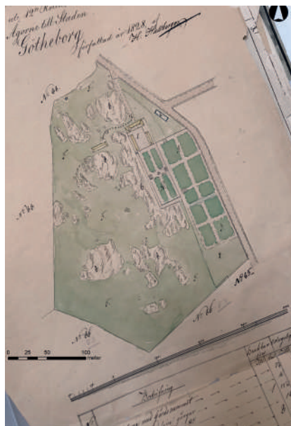
Figur 1. Karta över Johanneberg 1828. Här ser vi en trädgård med raka former och räta vinklar. Karta Regionarkivet G161 nr 4.

Kring mitten av 1800-talet förändrades trädgården. Söder om den befintliga trädgården skapades ett parti med mer svängda former och i den befintliga trädgården mjukades odlingsbäddarnas kanter upp och blev mer avrundade (figur 2). Ett orangeri tillkom kring 1800-talets mitt. Trädgården låg i en sluttning som förseddes med terrasser och trappor. För att skapa terrasserna lade man på upp till två meter tjocka lager med lera och dessförinnan hade man sprängt bort delar av bergknallen i trädgårdens västra del (figur 3). Utöver terrasser och trappor iakttogs trädgårdsgångar som belagts med ljus sand eller grus.