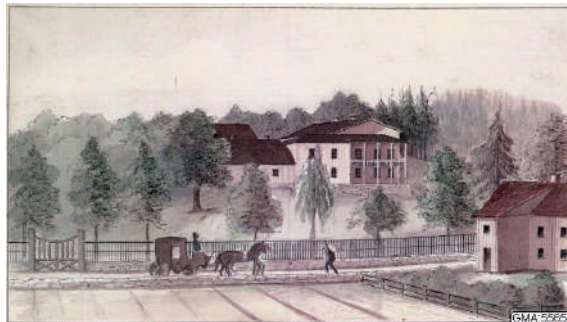
Figur 10. Johanneberg omkring 1850, sett nerifrån Södra vägen. Trädgården är bara skissartat redovisad, men intrycket är en lummig plats med uppvuxna träd, delvis dold för dem som passerade nedanför.