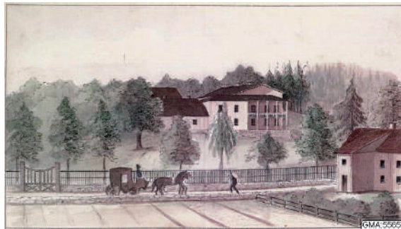
Figur 10. Johanneberg omkring 1850, sett nerifrån Södra vägen. Trädgården är bara skissartat redovisad, men intrycket är en lummig plats med uppvuxna träd, delvis dold för dem som passerade nedanför.