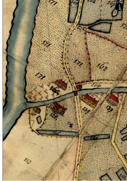
Figur 7. Marieholm (nr 165) på kartan 1696. Karta: Lantmäteriet N31-I:4.

I samband med de arkeologiska undersökningarna av Nya Lödöse