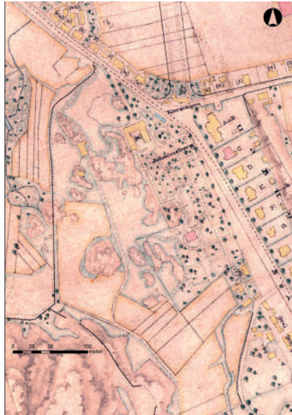
Figur 2. Karta över Johanneberg 1880. Nu har trädgården byggts ut mot söder och formerna blivit mjukare. Karta Regionarkivet GVI74a.

användas som gödning och jordförbättring. Tillsammans med den ständiga omgrävningen av trädgårdsjorden innebar det att stratigrafin var svårtolkad och huvuddelen av fynden knappast låg in situ.