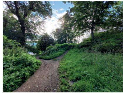
Figur 5. Trädgården på Stora Katrinelund. Miljön med slingrande gångar och växtlighet kan påminna om den äldre trädgården, men har förändrats påtagligt under 1900-talet.

alltså sådant att vi vet betydligt mer om byggnaderna, särskilt mangårdsbyggnaderna, än om de park- och trädgårdsmiljöer som omgav dem (Fischer 1923; Kulturmiljövision).