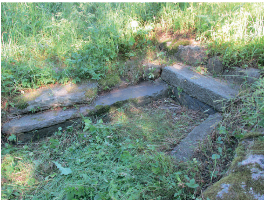
Figur 9. En liten stenbänk längs gången från Korsvägen upp mot universitets byggnader minner om en trädgårdsanläggning som fanns här under 1800-talets senare del.

Utsikter och siktlinjer är ett återkommande element i de flesta trädgårdsanläggningar, generellt sett. De användes även på landerierna. Flera landeriträdgårdar hade raka siktlinjer inom delar av trädgården, till exempel Kristinelund, där Ljungrens stadskarta från 1855 redovisar en trädgård med i huvudsak raka linjer. Ur en bouppteckning från 1824 framgår att här fanns flera dekorativa inslag, som fem byster på sandstensfötter, en "figur" av vit marmor, en Venusfigur och fyra träfigurer. Vi kan tänka oss att sådana figurer fanns som blickfång i fonden av gångar.