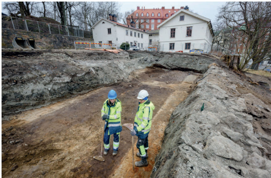
Figur 3. Här syns tydligt de tjocka lerbäddar som förts på för att jämna ut terrängen. Under dem ser vi spår av den äldsta trädgården. De mörka partierna är odlingsbäddar, de ljusa är sandgångar. I bakgrunden ser vi landeriets byggnader.

Ett av de viktigaste resultaten från undersökningen blev i stället de stora omdaningar av platsen som skett under den korta period den var i bruk. Omfattande resurser hade lagts på att skapa och omskapa trädgården genom sprängning av berg, påförande av massor och konstruktion av murar (figur 3). Förändringarna avspeglas inte fullt ut i de historiska kartorna, då dessas tvådimensionalitet döljer de omfattande arbetena med att omforma terrängen. Arbetena gjordes i flera omgångar och initierades av olika