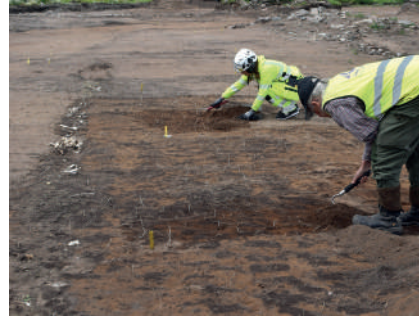
Figur 2. Parallella rader med spadstick rensas fram. Till vänster syns ett av de benfyllda dikena.

De senaste årtiondenas trädgårdsarkeologi har identifierat ytor med spår efter spadbruk som en tydlig indikation på småskalig odling, vanligtvis trädgårdsodling (Lindeblad & Nordström 2014:36; Andréasson Sjögren 2025:331). Men till skillnad från det oregelbundna gytter av spadstick som sådana lämningar normalt uppvisar avtecknade sig spadstickan vid Östra Eneby prästgård som långa, parallella rader (fig. 2). Stickan, som var ovanligt stora och upp till 0,21 meter breda, var i huvudsak halvmånformade med den raka sidan åt öster eller söder.