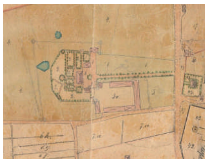
Figur 5. Östra Eneby prästgård 1861–62, med trädgården belägen på baksidan av manbyggnaden. De aktuella odlingsbäddarna har legat norr om allén, närmast gårdsplanen.

Trots att bärfröer är mycket vanligt förekommande i arkeologiska kontexter från historisk tid finns få säkra belägg på faktisk odling av bär; vad gäller odling av hallon är materialet ännu skralare. Med mycket stor sannolikhet är det just en hallonodling som dokumenterats i vid Östra Eneby prästgård, även om