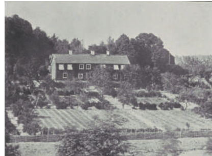
Figur 3. Stenbro prästgård (Södermanland) med typisk nyttoträdgård, troligen 1860-tal. Ursprunglig fotograf okänd. Foto: David Frederiksen. Kungliga biblioteket, Kart- och bildsamlingen.

Vad däremot förändras i prästgårdarnas trädgårdar under perioden efter 1600-talet är själva utformningen. Från att ha utgjort en nyttoträdgård med motsvarighet i bondgårdarnas kålgårdar (fig. 3) blir prästgårdsträdgårdarna under 1600- och 1700-talet alltmer inspirerade