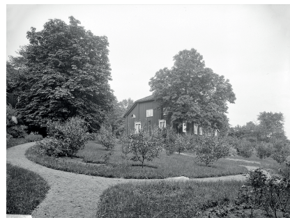
Figur 4. Asby prästgård med trädgård 1905. De organiskt formade ytorna kombinerar nytto- och lustträdgården där såväl fruktträd, (bär-)buskar, gångstigar och gräsytor ryms. Foto: A. C. Hultgren. OM.H.000037, Östergötlands museum, CC-BY-NC.

av parkliknande herrgårdsmiljöer (Flinck 1994:123). Under 1800-talet anammas den så kallade tyska stilen (fig. 4) med en blandning av regelbundna och organiska former, såsom slingrande gångar och rundade eller droppformade kvarter – en kombination av barockträdgård och engelsk park (Flinck 1994:92; Nohlin 2023:60).