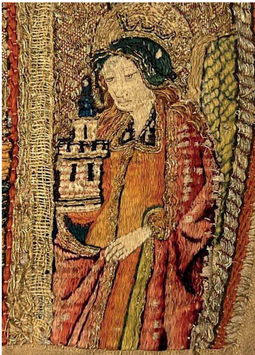
Figur 5. Mässhake från Österfärnebo (detalj). Här avbildas Sankta Barbara dyrbart klädd i rött, grönt och guld. Hon bär en krönt huvudbonad med bakgrund av en gloria. Hon sveper mantelfällden runt sitt attribut, tornet, som är krenelerat och försett med tre fönster. SHM inv. nr 5302.