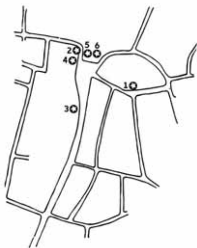
Figur 5. Platser i Lund där det påträffats föremål med anknytning till myntning. Kartan visar stadens tidiga gatunät. 1. Blyplåten med myntstampsavtrycket från Sven Estridsens tid, 2. Markvikt med avtryck av myntstämpel från Valdemar I:s tid, 3. Myntstamp troligen från Erik Plogpenningens tid, 4. Myntstamp från Kristoffer I:s tid, 5. Myntstamp med vid datering; slutet av 1200-talet fram till efter 1300-talets mitt, 6. Myntstamp troligen från Magnus Erikssons tid. Om dateringar se vidare Moesgaard 2015. Karta från Cinthio 1999.

Anders Andrén (1980, s. 72) fortsatte att utveckla diskussionen om myntverkets placering. Enligt Andrén var den nära kopplingen mellan kungsgård och myntverk, som Blomqvist och Mårtensson hävdade, förmodligen riktig. Utifrån den placering som Holmberg fört fram för kungsgården – att den låg precis väster om domkyrkan närmast motsvarande dagens Kyrkogata – hävdade Andrén att myntverket bör ha funnits i någon av byggnaderna inom detta kungsgårdsområde.