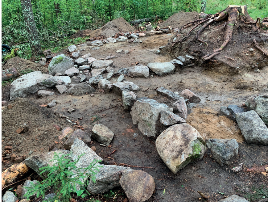
Figur 5. Husgrunden på "Lappens".

Precis som på det äldre bostället var det osteologiska fyndmaterialet omfattande. Totalt tillvaratogs 5,5 kilo djurben. Nöt och häst dominerar. En stor del av benen är mörgpaltade, även de av häst, vilket visar att hästen inte bara slaktats utan även ätits. Precis som på det äldre bostället är detta anmärkningsvärt. Ätande av hästkött betraktades närmast som tabu i Norden (Egardt 1962), men bland en del samer kom hästkött att ses som tjänlig föda och förefaller utvecklats till ett distinkt inslag i sydsamiska mattraditioner.