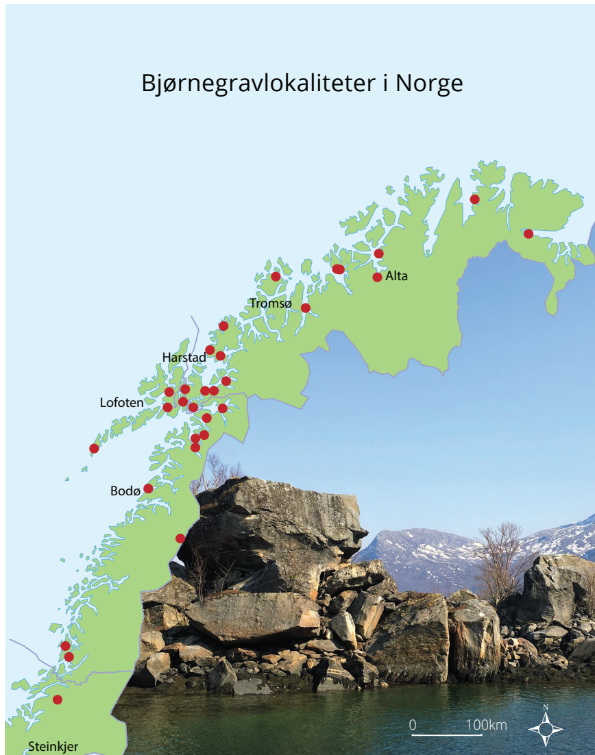
Figur 1. Utbredelse av bjørnegraver i Norge. Et typisk landskapstrekk ved gravene langs kysten er at bjørnebeinene ligger under store steinblokker. Bjørnegrav i Nevelsfjord i Bodø kommune datert til 11-1200 tallet. Foto: Ingrid Sommerseth, Grafikk: Grafiske tjenester, Norges arktiske universitet UiT.

tradisjonene og de rituelle handlingene. De tidligste kildene finner vi i de mange misjonsberetningene fra 1600 og 1700-tallet (Niurenius 1645; Rheen 1671; Schefferus 1673; Dass 1739; Fjellström 1755; Leem 1767; Friis 1871). Utover