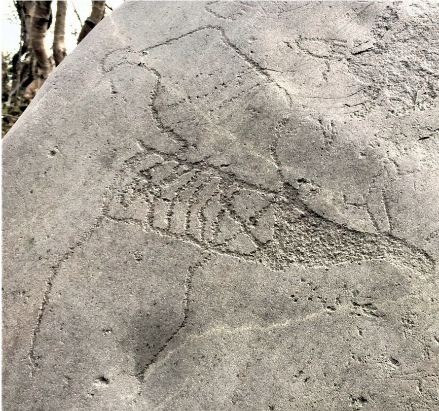
Figur 6. En bjørn som angriper en rein? Bjørnehodet er plassert i reinens skulderparti. Over bjørnen er det to bjørnespor med klør. Motivet kan også tolkes som en symbiose mellom rein og bjørn der begge dyrene blir oppfattet som like viktig for menneskene. Helleristningen er nylig funnet på Isnestofen i Alta kommune, datert til 5000–4000 BCE.