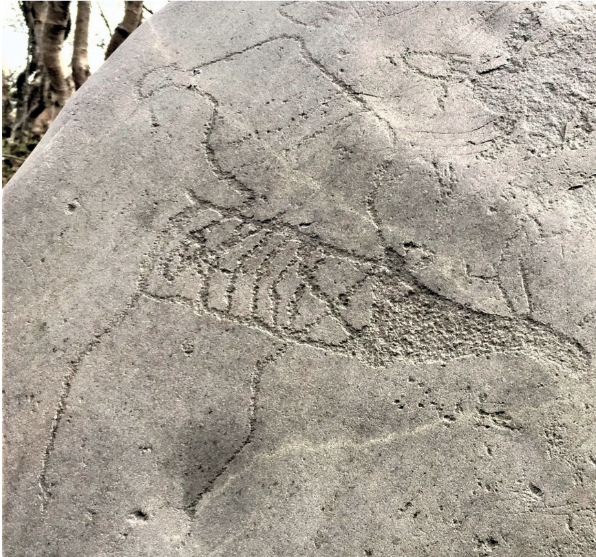
Figur 6. En bjørn som angriper en rein? Bjørnehodet er plassert i reinens skulderparti. Over bjørnen er det to bjørnespor med klør. Motivet kan også tolkes som en symbiose mellom rein og bjørn der begge dyrene blir oppfattet som like viktig for menneskene. Helleristningen er nylig funnet på Isnestoften i Alta kommune, datert til 5000–4000 BCE.