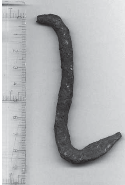
Figur 7. Under galgen hittades en krok som av utformningen att döma har suttit fastnaglad i trä. Kanske har den använts för att fästa upp avhuggna kroppsdelar, androm till varnagel?

lika länge som staden funnits, har gjort att galgen traditionellt daterats till 1100-talets andra hälft. Mellan det förmodade uppförandet på 1100-talet och 1555 finns dock inga skriftliga belägg för att galgens ska ha existerat eller ens att Galgberget varit en avrättningsplats.