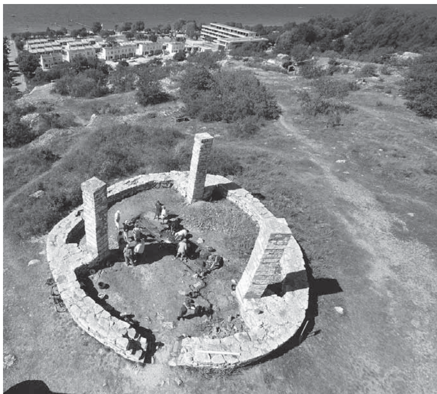
Figur 3. Galgen från ovan.