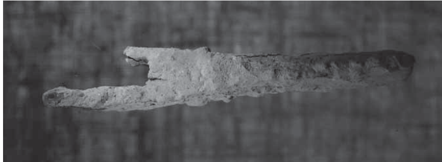
Figur 7. Parerstång till svärd (F8) från undersökning i augusti 2008.

ment, sex spjut- eller lansspetsar, 12 sporrar, nio mestadels små järnprojektiler, 20 små mestadels kvadratiska blyprojektiler, 10 ringbrynje-fragment samt armborstfragment, spetsar till spikklubbor, stridsknivar, pilspetsar och rustningsdetaljer i form av lameller, söljor och beslag samt enstaka fynd av personlig utrustning. Resultaten har redovisats i årsrapporter (Lingström 2007–2019, se www.masterby1361.se , samt www.samla.se ). Slagfältsfynden har paralleller till Korsbetningen, men kompletterar lika ofta detta material, inte minst när det gäller vapen. Inga vapenfynd har gjorts i gravarna i Visby. Mästerbyfynden utgör därmed en mycket viktig förståhandskälla till information om den danska invasionen år 1361. Sammantaget gör fynden och deras spridning att vi näst intill minut för minut kan följa striderna mellan gotlänningarna och den danska armén.