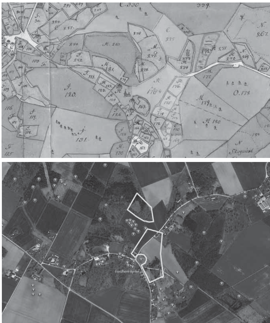
Figur 7a och b. På en höjdsträckning norr och nordöst om Fardhem kyrka finns på skattdokumenteringen Tingz-Ruhm, Tingzängen och Tingzkull åker. Ågorna var delade mellan fem gårdar, bland andra Prästgården. Här låg ett stort gravfält med rötter i bronsåldern, som det bara finns spillror kvar av idag. Dåvarande prästen uppgav år 1799 att han "upprivit många hedna rör och gravar, bortfört 1000:de tals lass sten till anlagde gärdesgårdar och där funnit de rör som haft över 800 lass sten i sig" (Östergren 2018, s. 51). Fardhem var en av Gutalagens tre asylkyrkor. Kartorna är hämtade ur Östergren 2018.

ägospplittring. Tinget tycks ha tagit förhållandevis stora ytor i anspråk. Kriterierna för de gotländska tingsplatserna är i stort sett desamma som för tingsplatserna i övriga Norden. Vid ett seminarium i Visby den