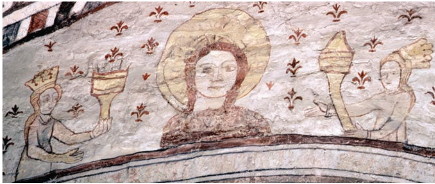
Figur 4 (nedre bilden). Gökhem kyrka, Västergötland. Målning av Amund Nilsson, 1487.

mest om samtida ljushållare eller ljusstavar i trä. De två första sorterna föreställer eller refererar istället troligen till olika sorters glaslampor. Det finns tydliga paralleller till dessa former, bland annat i fynd från Tjeckien och Tyskland (Baumgartner & Krueger 1988, s. 437–438, se fig. 5 och 6). De trattformade varianterna liknar sådana glaslampor som avbildas hängande i ställningar i västeuropeiska, medeltida manuskript, men som alltså också hittats som arkeologiska fynd. I England hör glaslampor av den här typen