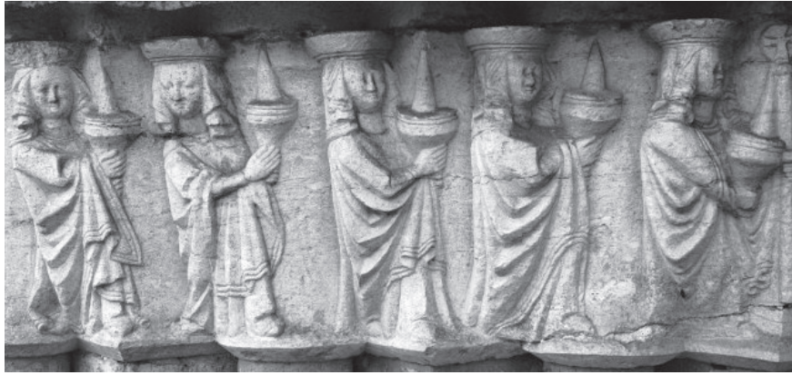
Figur 3 (övre bilden). Visa jungfrur i korportalen i Burs kyrka, Gotland. Foto Alfred Edle 1941. Kulturmiljöbild