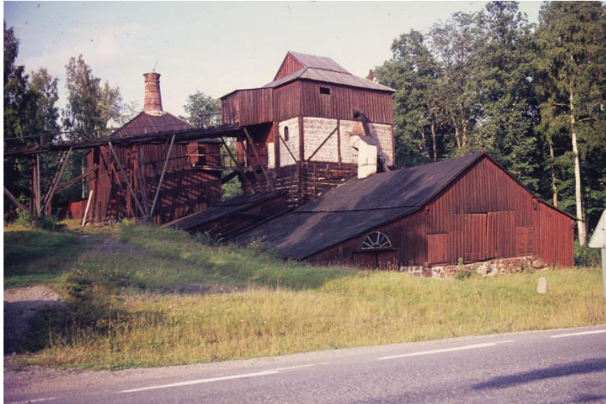
Figur 1. Engelsbergs bruk och masugn. 1960-tal

konst, arkitekturhistoria och industriarv betonades (Nisser 1996, s. 76–77). I samma skede, under tidigt 1990-tal, fick Riksantikvarieämbetet ett utökat ansvar för kunskapsuppbyggnad kring industriminnesvård (Isacson 2003). Efter en intensiv fas fälnade intresset något i Sverige, medan den anglosaxiska industriarkeologin förefaller ha behållit sin position (Symonds 2005). Inflytande från neomarxism och poststrukturalism stärkte det akademiska intresset för industrialismen som produktionsform och studieobjekt i Storbritannien och i USA. En annan skillnad mellan Norden och Storbritannien är arkeologijämnet nära släktskap med antropologi men även socialhistoria (jfr Johnson 1996; Shackel 1996; Knapp et al., red, 1998). Stephen Mrozowski och James Symonds studier om klassformeringsprocesser