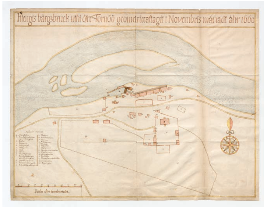
Figur 5. Karta över Kengis bruk av lantmätare Olof Simonsson Naucér 1660, foto Riksarkivet, Bergskollegii gruvkartor.

com/2018/10/19/arkeologiska-experiment-2019-jarnframställning-i-vivungi/).