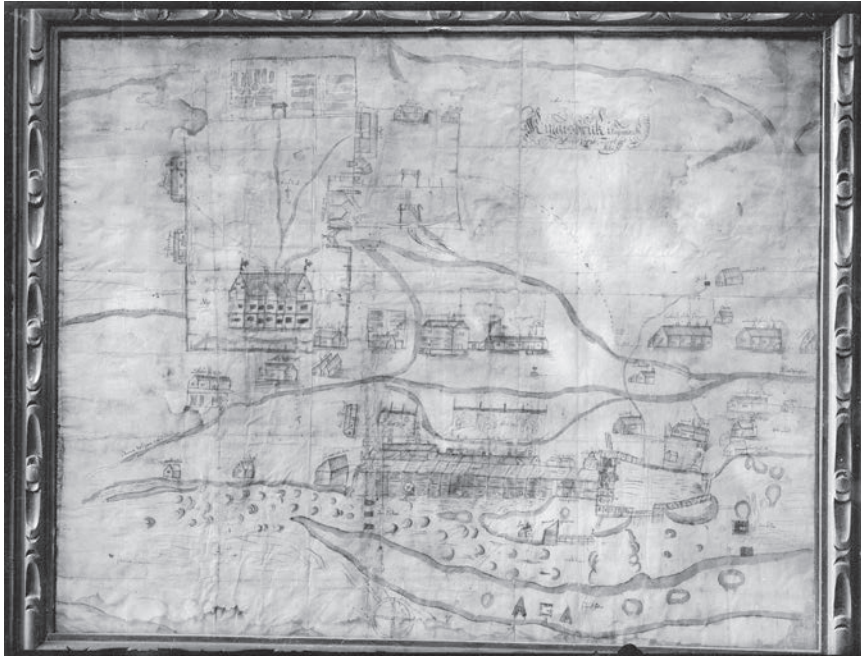
Figur 4. Teckning över Kengis bruk 1660 av Denis Joris, foto Jernkontorets bruksbildskatalog

ningen inskränkningar i det samiska självbestämmandet (jfr Bromé 1923, s. 157–158; Nordin 2012, 2015). Det är också viktigt att komma ihåg att kronan visste att tvinga fram uppgifter om metallfyndigheter som i fallet med Sjängeli, invid Torneträsk, 1696 där fyndplatsen avslöjades efter hot om gatlopp (Wallerström 1996).