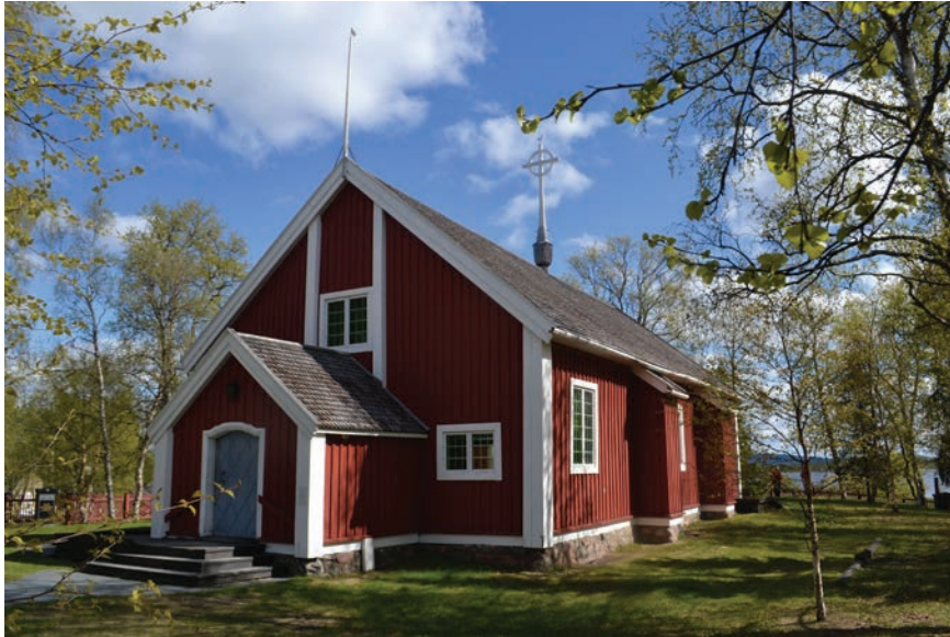
Figur 6. Jukkasjärvi kyrka, uppförd under 1600-talet.

den uppfördes. Genom koppar- och mässingshandeln och den monopolliknande positionen hade bröderna också kontroll över en av den atlantiska ekonomins mer eftertraktade varor. Mässingen såldes ofta som tråd till Nederländerna och senare till England där den blev till nålar, hyskor och hakar till korsetter och andra spännen. Fyndet av det så kallade Læsø-vraket i Öresund på 1950-talet gav en direkt bild av mässingsexporten. Stora mängder mässingstråd stämplade med familjerna De Geers och Momma-Reenstiernas vapen påträffades ombord. Skeppet hade uppenbarligen förlist på sin väg från Norrköping till Amsterdam (Helmfrid 1959; Nilhamn 2012; jfr även Zahedieh 2013).