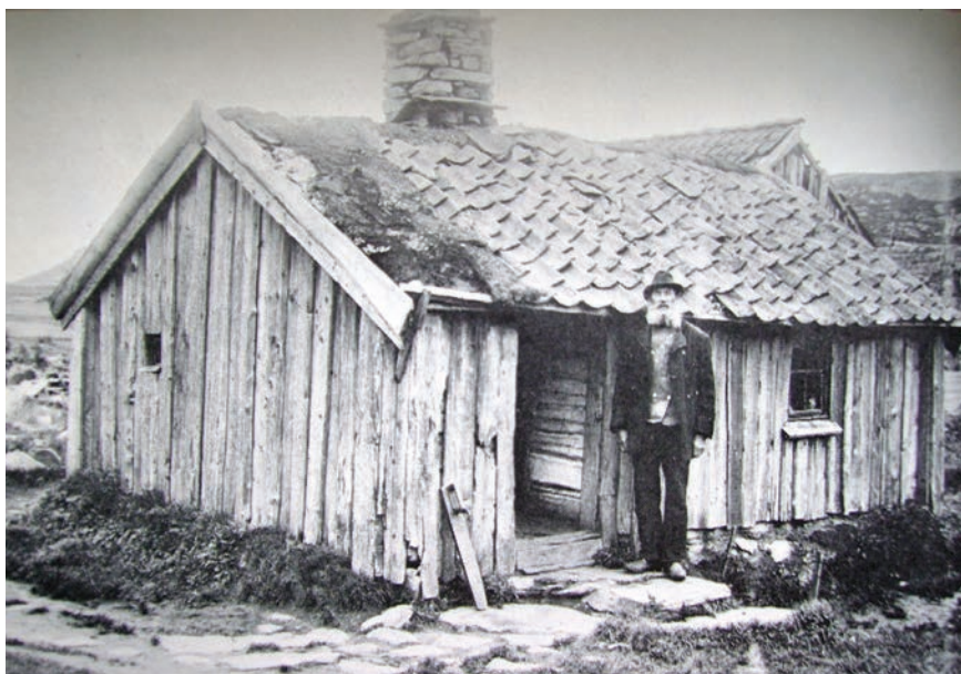
Figur 1. Torpstuga i Bohuslän, tidigt 1900-tal.

relation till årtalet 1850 är ytterst oklar. Många nya typer av fornlämningar är dessutom dåligt inventerade och registrerade, vilket innebär att de löper större risk än andra typer av lämningar att förstöras av ovarsamhet, exempelvis i samband med skogsbruk. Det finns således ett stort behov av att utveckla metoder kring inventering, registrering och kunskapsspridning om den här typen av lämningar till stora grupper, både inom och utom den antikvariska världen. Många av de här ”nya” fornlämningarna är också sådana som framför allt kan knytas till den stora gruppen obesuttna i samhället.