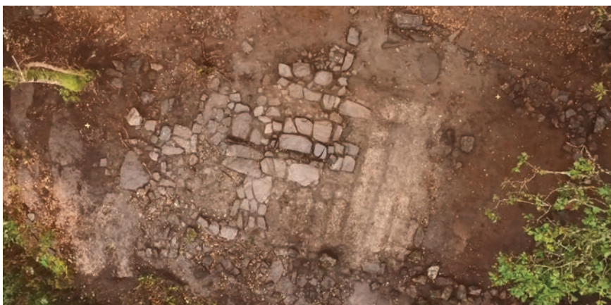
Figur 2. Torpet Tjuvkil i Bohuslän undersöktes 2017. Torpet etablerades kring år 1810 och existerade fram till mitten av 1800-talet. På bilden ses boningshuset med härden i ett rum mitten av huset och två kammare på ömse sidor.

med den som framträder i skriftliga källor.