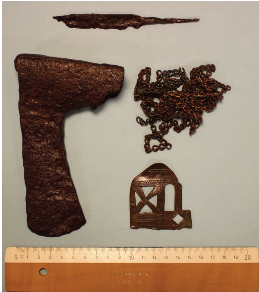
Figur 6. Samtliga föremål som påträffades i graven. Vad mässingsplåten ursprungligen varit är okänt. Nederkanten ser ut att ha brytmärken.

under en berghammer. Mellem de større stene, som omgav rummet, var der kilet ind mindre, og det hele var dækket av flate heller.” På mer än ett sätt ganska likt graven i Gransjön. Att graven från Mösjöen är intressant för Petersens artikel om björnkult är just mässingringen som fanns i graven. 1937 hade Petersen fått sig tillsänt ett björnkranium med en mässingkedja lindad runt kindbenet (Petersen 1940, s.