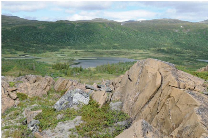
Figur 4. Från offerplatsen har man utsikt över sjön och dalgången med sina visten och renvallar.

samma bergknalle som graven. Till skillnad från gravplatsen har man här utsikt över hela Gransjödalen (Fig. 4). Offerplatsen bestod av en