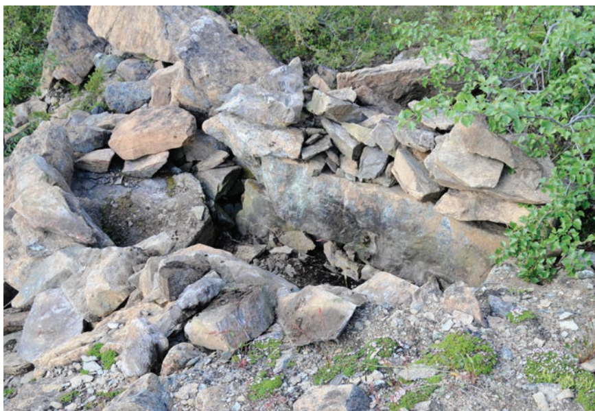
Figur 5. Graven efter att den rensats från lösa stenar.

(Jönsson 2011, s. 3-5). Den osteologiska analysen gav intressanta resultat. De flesta benen härrörde från en renkalv som deponerats innan den blivit en månad gammal. Detta betyder att offret måste ha utförts från slutet av maj till slutet av juni. Tillsammans med benen från kalven fanns även rester av en vuxen ren. Den var representerad av samtliga fyra klövar. Möjligen kan detta tolkas som att kalven lindats in i ett renskinn där klövarna varit kvar. Hela skinn har just ofta fotbenen kvar. Anmärkningsvärt är också att inga ben hade spår efter skär- eller huggmärken. Något som annars är ofta förekommande vid rendepo-neringar (Boëthius 2010). Dateringen var inte mindre intressant, 175 +/- 50 BP. Kalibrerat med två sigma ger det en tidigaste datering till 1650 och fram till nutid (LuS