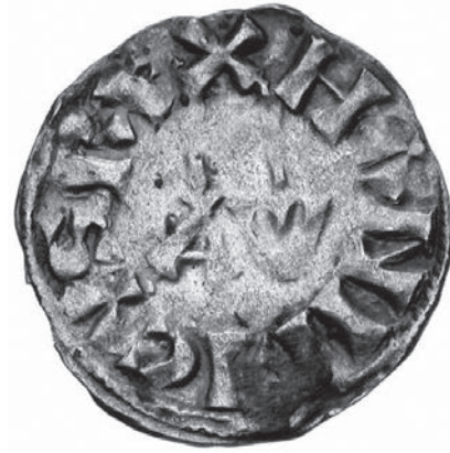
Figur 3. Mynt slaget för Annas gemål, Henrik I, i Paris. Inskription HANIRICVS REX. I mittfältet hängande alfa och omega (s. k. pendilia), en Kristussymbol.

Som en parallell till Ingegerdsringen från Sigtuna förekommer i källorna en ring som eftervärlden förknipat med Anna Jaroslavna. Det omnämns nämligen att den dåvarande kungen Ludvig VI år 1137 donerade en ring med en ovanlig ädelsten, en brandgul, genomskinlig så kall-