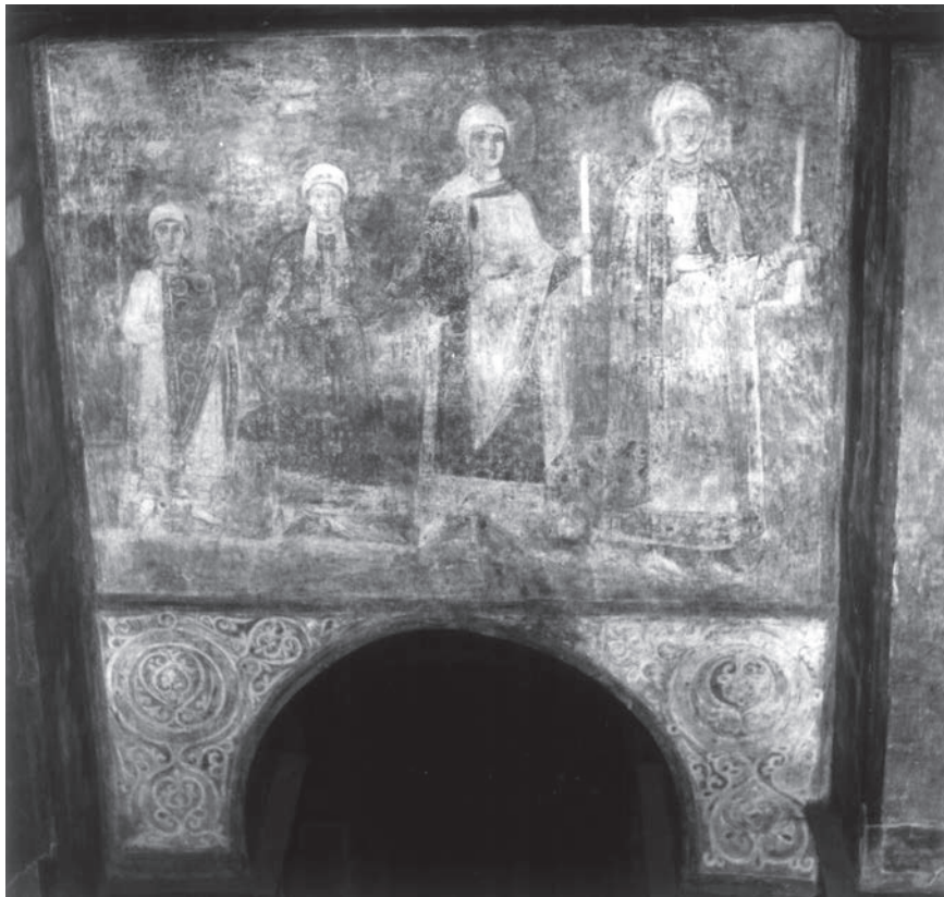
Figur 2. Fyra av Jaroslavs och Ingegerds barn i Sofiakatedralen i Kiev. Anna kan vara den första eller andra personen från vänster. De nästan 1000 år gamla freskerna är svårt skadade och många gånger restaurerade. Hela storfurstefamiljen var ursprungligen avbildad, men detta är det bäst bevarade väggpartiet.