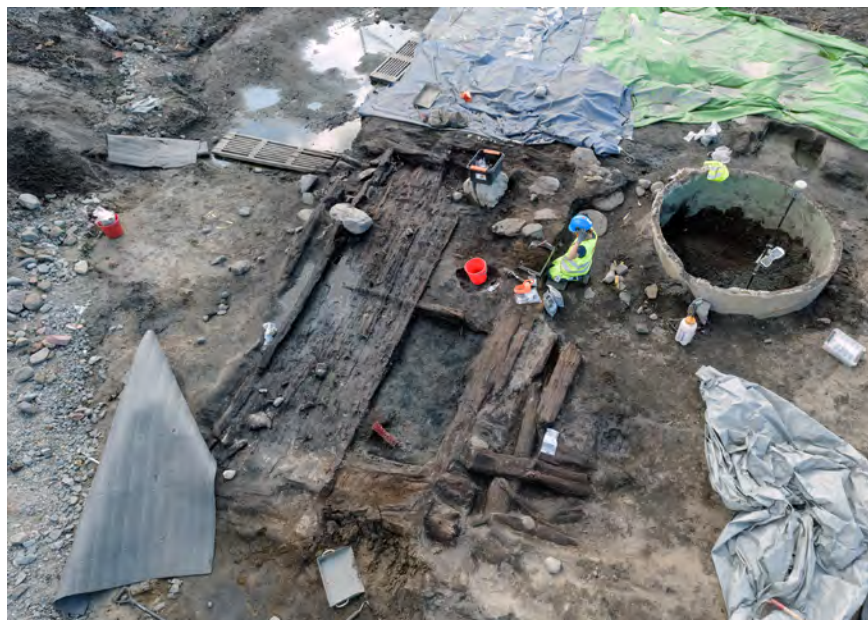
Figur 3. En av stadsgårdarna under utgrävning sommaren 2015.

Till skillnad från det arkeologiska materialet, som åtminstone på en generell nivå ger intryck av ganska stora likheter mellan stadsgårdarna, visar taxeringslängderna att det var mycket stora ekonomiska skillnader mellan borgarna. Bland de mest förmögna i staden fanns flera inflyttade borgare från tyska och holländska områden, men också en del svenska